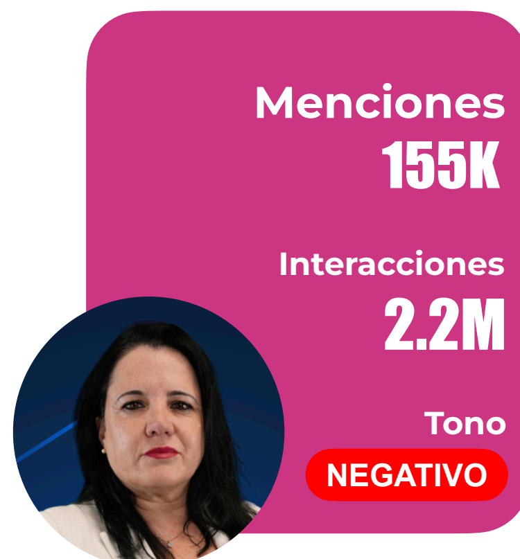
Trinidad Steinert Seguridad Pública