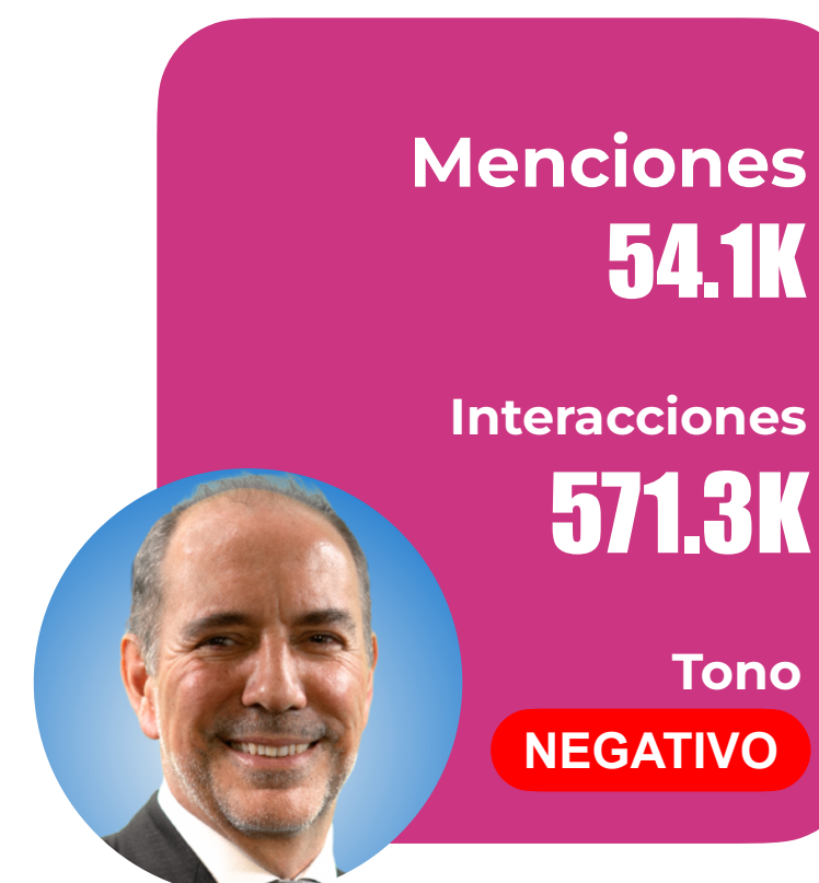
Louis de Grange Transportes y Telecomunicaciones