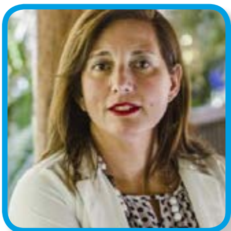
Paulina Vodanovic Presidenta Horizonte Ciudadano